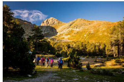
Le refuge des Cortalets, le Pic du Canigó et le cirque des Cortalets

Afin de permettre la réalisation de ces travaux d'envergure dans les meilleures conditions de sécurité et d'efficacité, le refuge – et plus largement le site des Cortalets – fonctionnera en « mode dégradé » à compter du 28 juin 2026, et ce pour trois saisons estivales complètes :