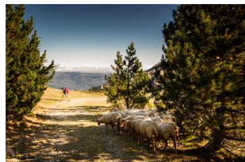
Pastoralisme et activités récréatives sur le massif du Canigó