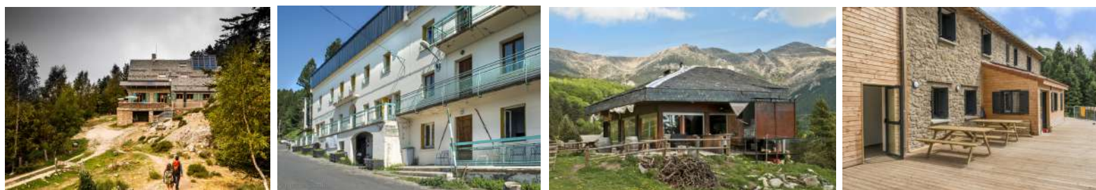
Les refuges gardés de Marialles, Batère, Les Conques et Sant Guillem, photos : SMC GS, CD66

Choisir la demi-pension permet souvent de vivre l'expérience plus sereinement, avec un sac plus léger, un repas chaud à l'arrivée et un vrai temps d'échange avec les autres randonneurs. Quelle que soit la formule retenue, une nuit en refuge se prépare en amont. Sur le Canigó comme ailleurs, le respect de ces quelques règles est la base d'un véritable contrat social en montagne.