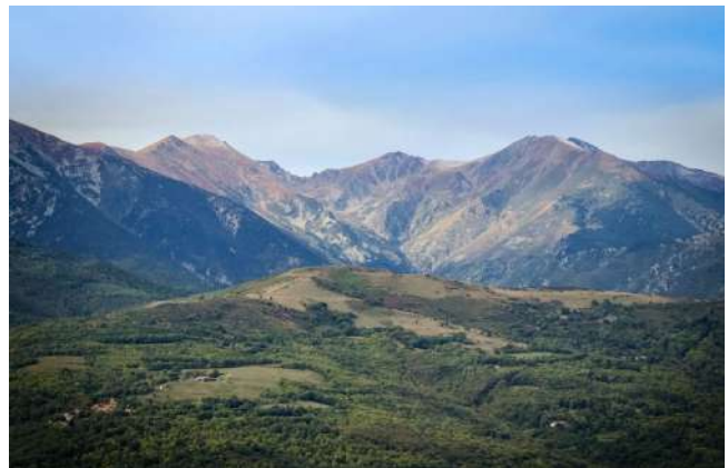
Le piémont du Canigó vers le Mont Santa Anna