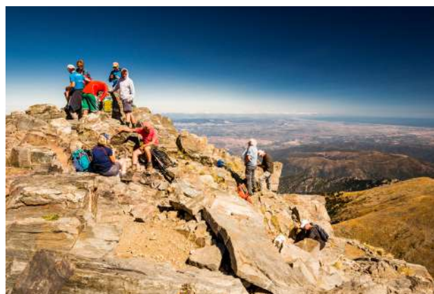
Randonneurs au pic du du Canigó.