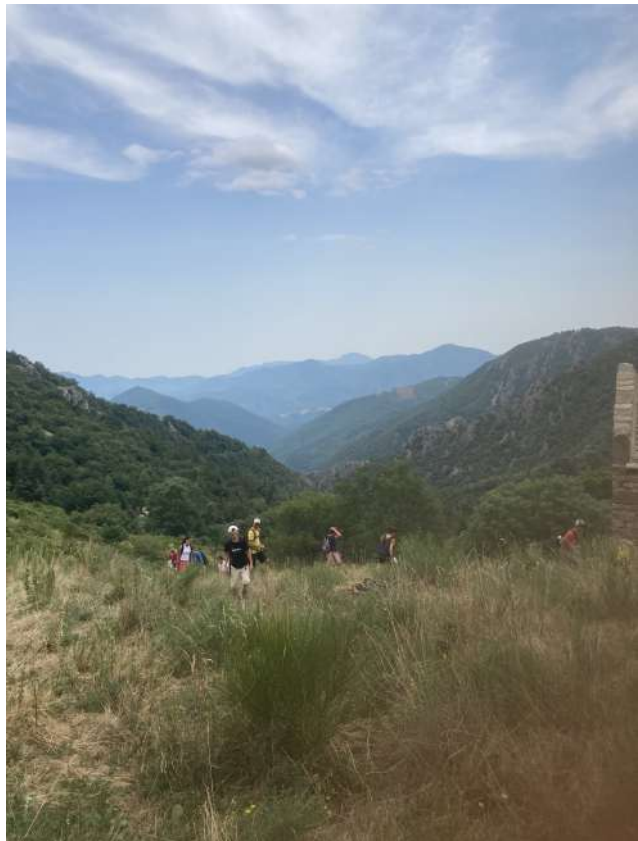
Animations sur le massif du Canigó, SMC GS.