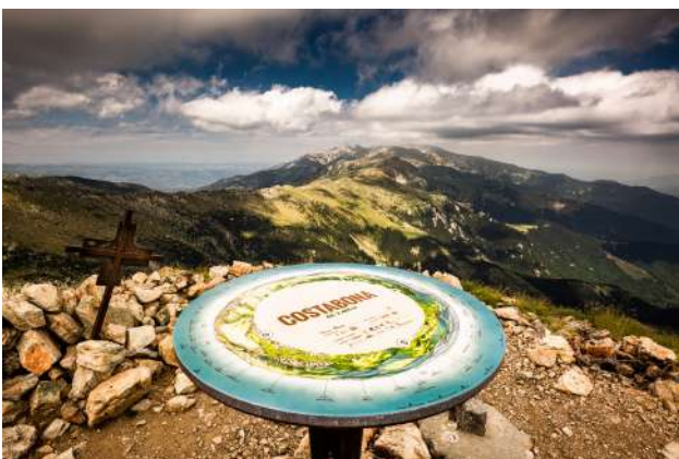
Table d'orientation au pic du Costabona