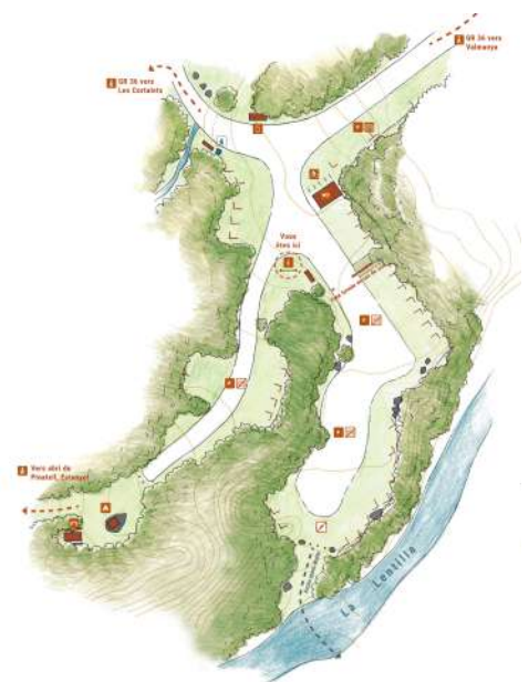
Plan de fonctionnement du site d'accueil, dessin : Lucie Julie, SMCGS