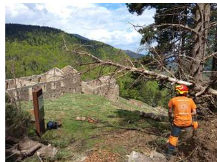
Arbres au sol à La Pinosa.

Les tempêtes hivernales Niels , Ilona et Pedro ont encore aggravé la situation, en particulier dans les couloirs de vent et sur plusieurs secteurs du versant sud du massif, notamment en Haut Vallespir.