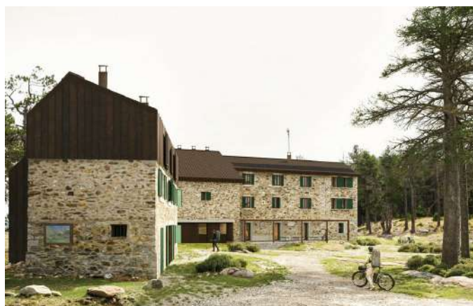
Images de projection du bureau d'architectes Tryptique, 2025