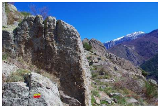
Piste d'accès et sentier de randonnée sur le massif du Canigó