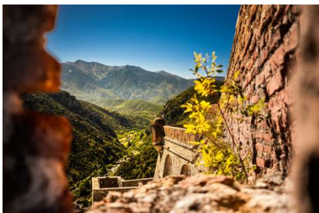
Vue sur le massif depuis le Fort Libéria.