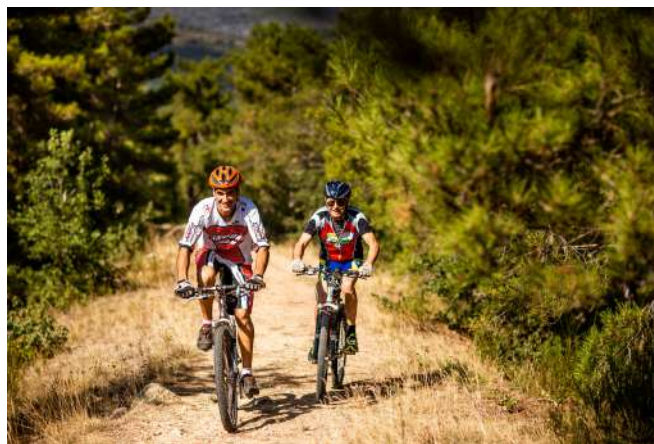
Le Canigó se découvre aussi sans voiture