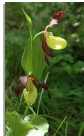
Sabot de Vénus - P. Gaultier

→ Quelques espèces susceptibles d'être impactées par les activités, faisant partie de la Directive Oiseaux et présentes sur le site Natura 2000 Canigou-Conques de la Preste .