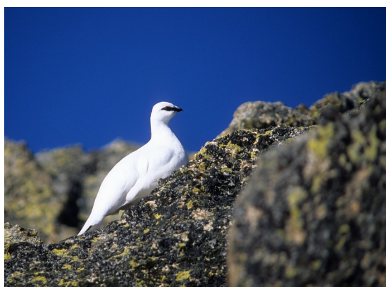
Lagopède alpin des Pyrénées - J. Feijoo (GOR)