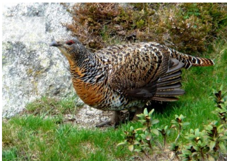
Femelle de Grand tétras - L. Courmont