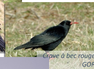
Crave à bec rouge GOR