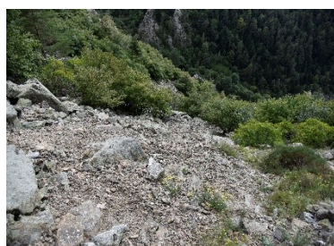
Éboulis siliceux de l'étage montagnard à nival