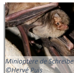
Minioptère de Schreibers