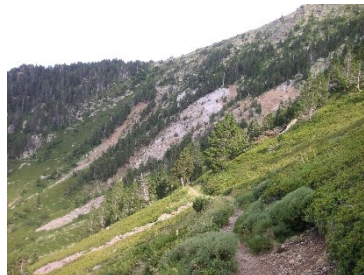
Pentes rocheuses calcaires avec végétation chasmophytique