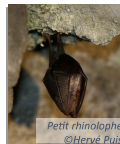
Petit rhinolophe

→ Quelques espèces susceptibles d'être impactées par les activités, faisant partie de la Directive Oiseaux et présentes sur le site Natura 2000 Canigou-Conques de la Preste .