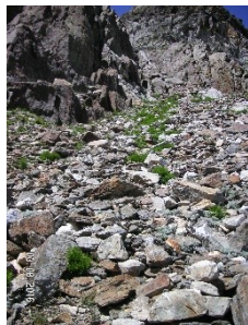
Éboulis ouest méditerranéens