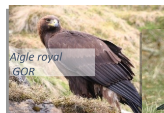
Aigle royal GOR

*Espèces non nicheuses sur le site Natura 2000 Canigou-Conques de la Preste mais qui fréquentent régulièrement ce site.